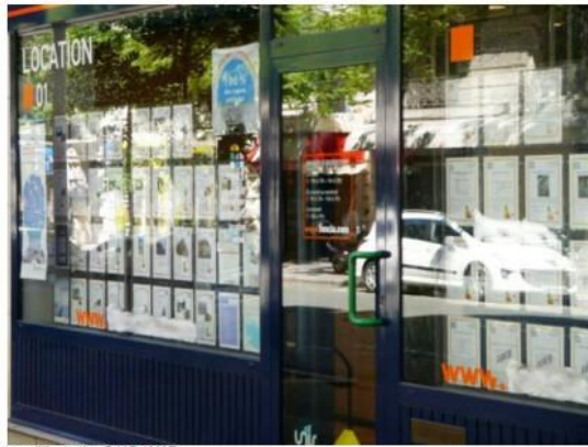
Image d'illustration